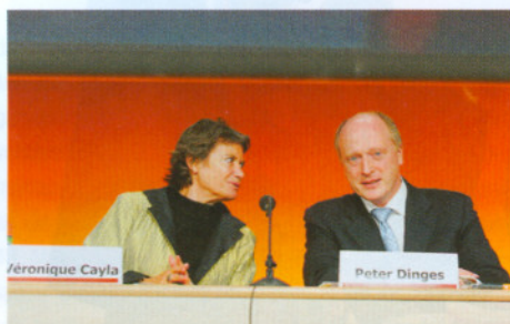
Offizielle Eröffnung durch Veronique Cayla und Peter Dinges

betreffen die Qualität und Sicherheit, sowie den einheitlichen technischen Standard und die Neutralität des verwendeten Equipments. Die detaillierte Erklärung ist nachzulesen unter http://www.filmfoerderungsanstalt.de/downloads/digitaleskino/erklaerung_CNC_FFA.pdf .